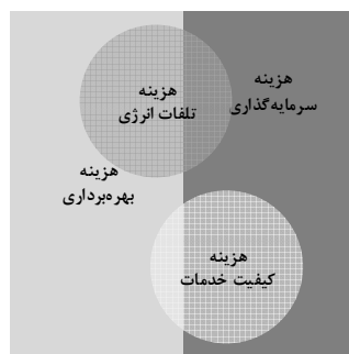
شکل (۱): دسته‌بندی هزینه‌های شرکت‌های توزیع الکتریکی

به منظور محک‌زنی جنبه‌های مختلف کارایی هزینه‌های شرکت‌های توزیع الکتریکی، این هزینه‌ها می‌توانند بر اساس اهداف اصلی هزینه‌ای دسته‌بندی شوند. دسته‌بندی هزینه‌های شرکت‌های توزیع الکتریکی در شکل (۱) نشان داده شده است.